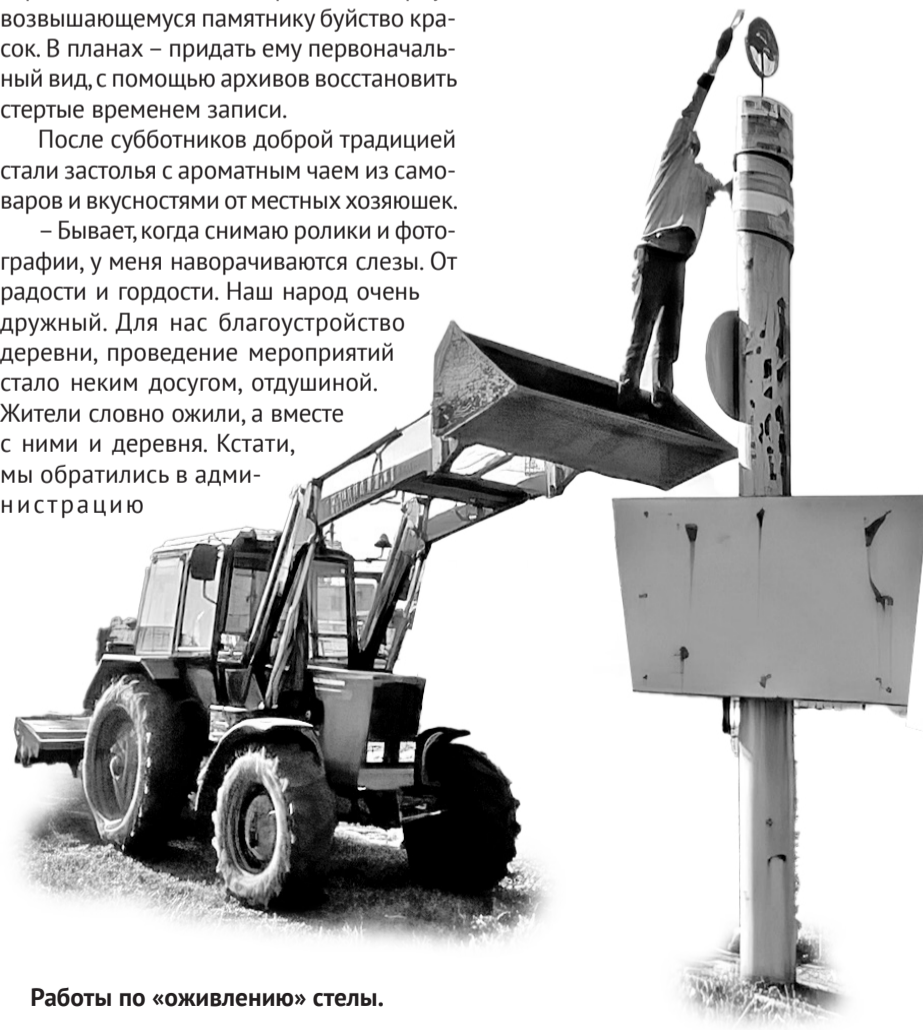
Работы по «оживлению» стелы.

Много дел сделано в Новых Карамалах с появлением команды активистов, сплотивших вокруг себя остальных сельчан. Впереди работ не меньше. Пусть все задуманное у карамалинцев свершается, а энтузиазм и энергия не убавляются!