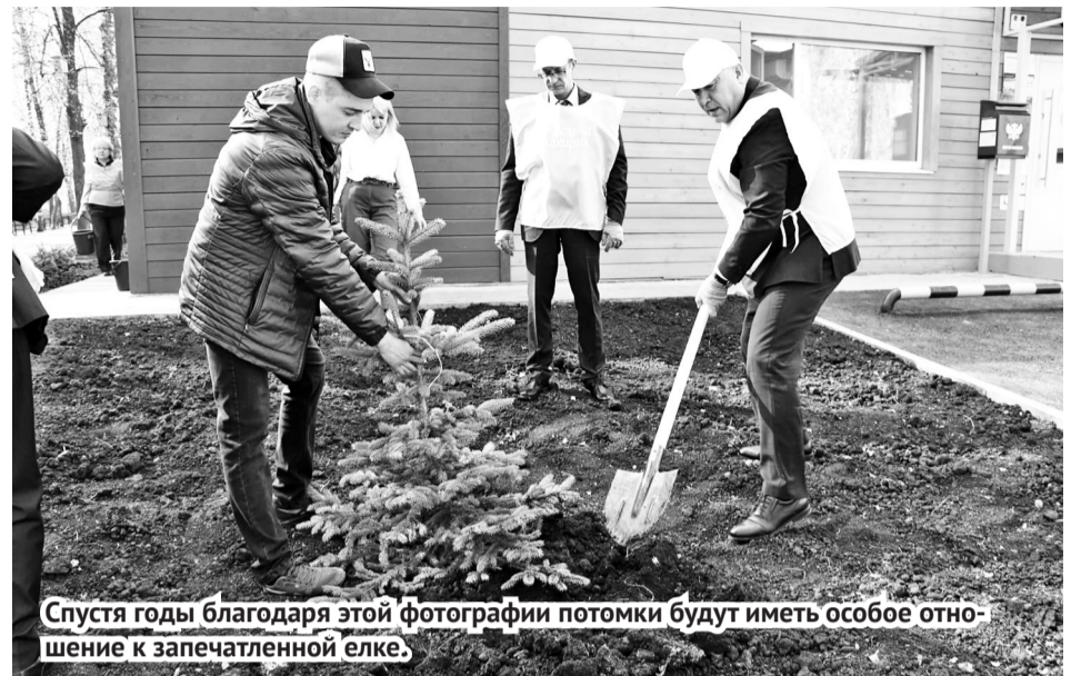
Спустя годы благодаря этой фотографии потомки будут иметь особое отношение к запечатленной елке.

логической акции «Зеленая Башкирия». Возле почтового отделения села Толбазы Сагитов вместе с местными жителями высадил молодые деревья. Как отметил гость, совместное озеленение – не только вклад в экологию, но и воспитание бережного отношения к природе у молодого