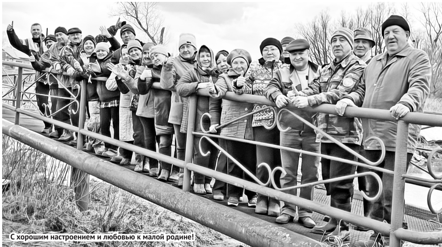
С хорошим настроением и любовью к малой родине!