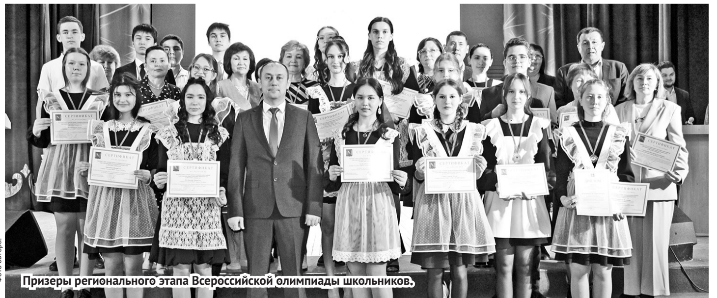
Призёры регионального этапа Всероссийской олимпиады школьников.

Поздравляем участников «Звездного Олимпа»! Пусть каждая победа станет ступенькой к новым вершинам!